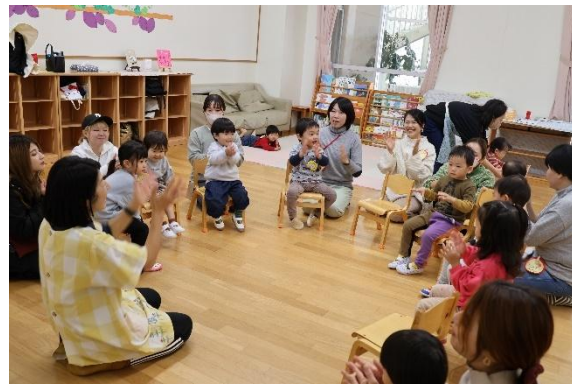
みんなで絵本や手あそび