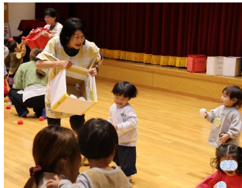
かけっこに玉入れ、しっぽ取りにダンス…盛りだくさんでしたね