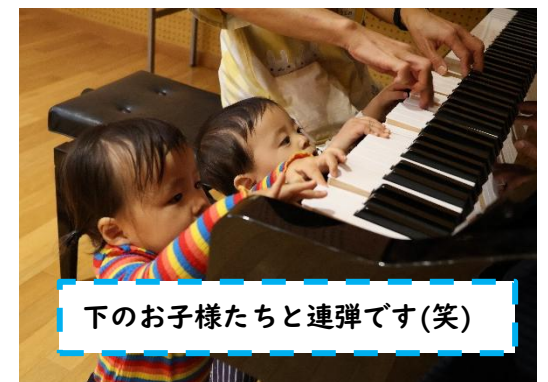
下のお子様たちと連弾です(笑)

体を動かすのが大好きなのでとても楽しそうでした。特に今日は雨だったので、ホールでのお遊びで発散できて最高でした。