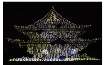
上映予定作品の一部